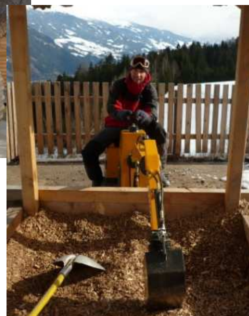
... a okolo bagřítka ;).