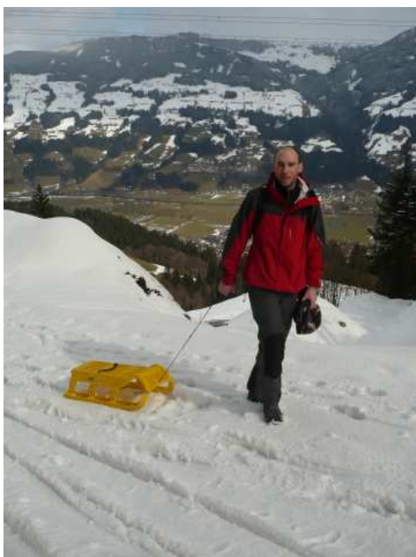
Na Rodelbahn Fügen bylo ještě dost sněhu (nad zasněženou hranicí, která je vidět naproti na svahu, někdy až moc), ale dole v údolí Zilleru se již zelenají louky.