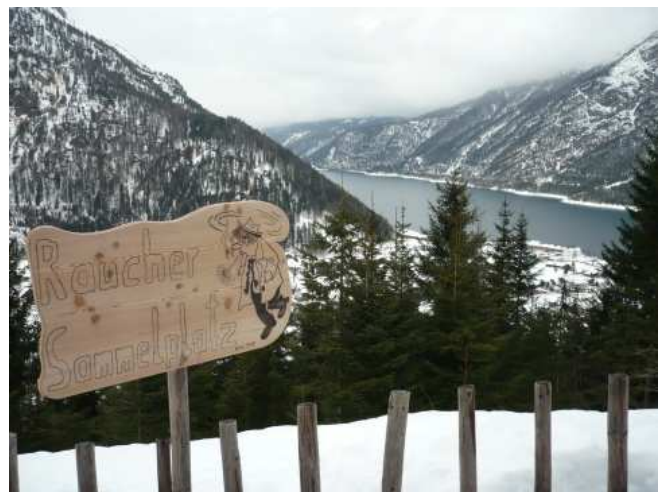
Kuřácké místo u Rodelhütte a výhled na Achensee.