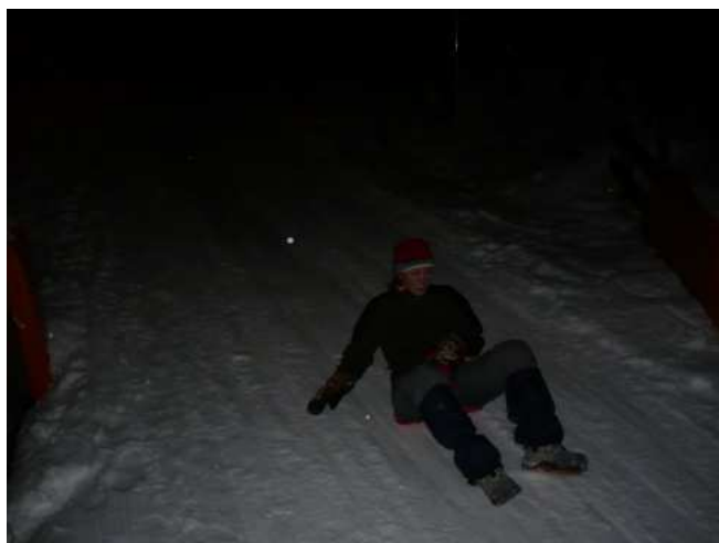
A noční sjezd na různých dopravních prostředcích. Dráha je upravovaná rolbou, takže se závodník neboří v hlubokém sněhu a i na pekáčích to sviští v některých částech 30km/h :). Vše z Rodelbahn Maurach.