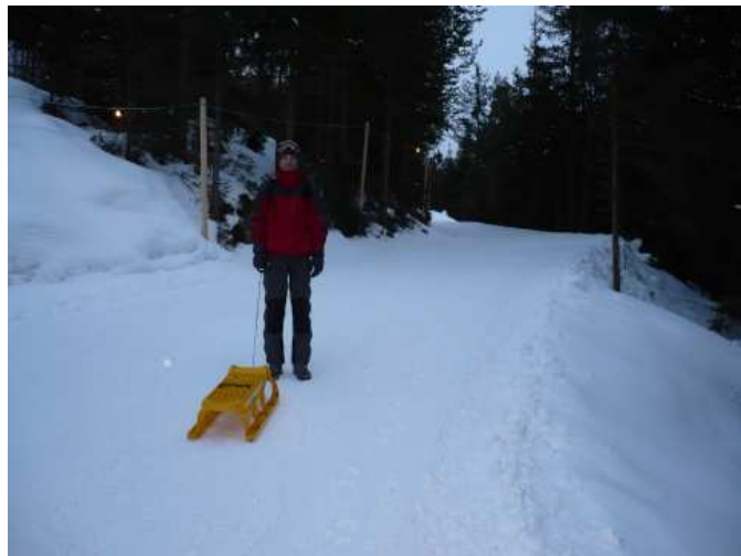
Večerní výšlap a pohled z jedné zákruty na Maurach a Achensee (tady je ještě společná cesta pro sjezdovku i sáňkařskou dráhu)