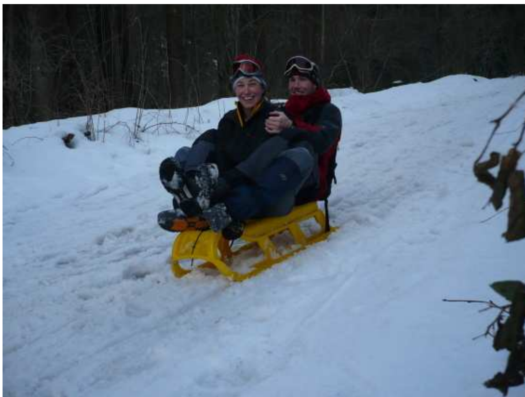
Technika „Jak sedět na sáňkách“ když už bolí nohy. Zde náš tip ;). Dojezd Rodelbahn Fügen.

Na závěr nutno dodat, že jsme si všechny Rodelbahn vyšli sportovně po svých a nepoužívali jsme žádné Expresy. V sáňkování, vybírání zatáček, kličkování mezi vytátými místy i technice sezení na sáňkách se stále zlepšujeme.