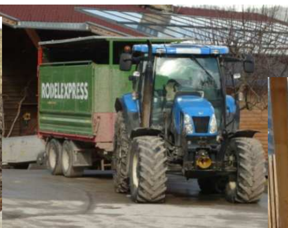
..okolo stanoviště místního Rodelexpressu...