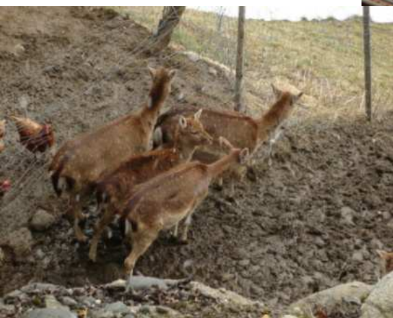
Cca v polovině se prochází okolo výběhu „divoké“ zvěře...