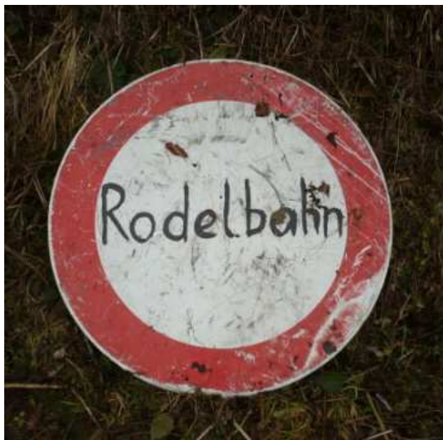
Achtung Rodelbahn. Cedule u dolního konce sáňkařské dráhy Uderns.

Co dělat, když stále padá sníh na túry se chodit nedá, lyžování u nás na sjezdovce už nás nebaví a běžky zůstaly v UL? Jednoduchá odpověď. Sáňkovat.