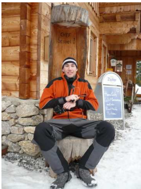
Šéfovská židle u Rodelhütte. A velký šéf. ;)

Sáňkování v Pertisau má i částečně naučnou formu (pro ty kteří se nenechají vytáhnout Rodelexpressem), podél cesty nahoru jsou různé otvírací stromobudky s popisem. Zajímavé a vtipné :).