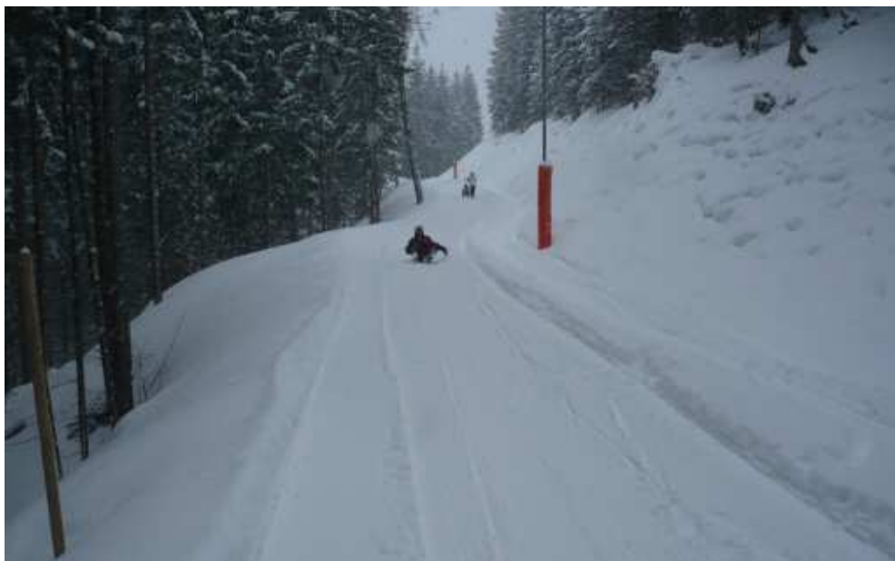
Rodelspass :). Dráha u Pertisau.

Další Rodelbahn, večer také osvětlená, se nachází v nedalekém Pertisau. To je vyloženě komerční sáňkařská dráha, kde lenochy nahoru vyveze za mírný poplatek 6eur/osobu tzv. Rodelexpress (traktor s vozíkem). A nahoře už čeká Rodelhütte (sáňkařská chata☺), kde si lze vypůjčit sánky a dát svařáka a pak hurá dolů. Trať je dlouhá 1,5km a převýšení je také cca 150m.