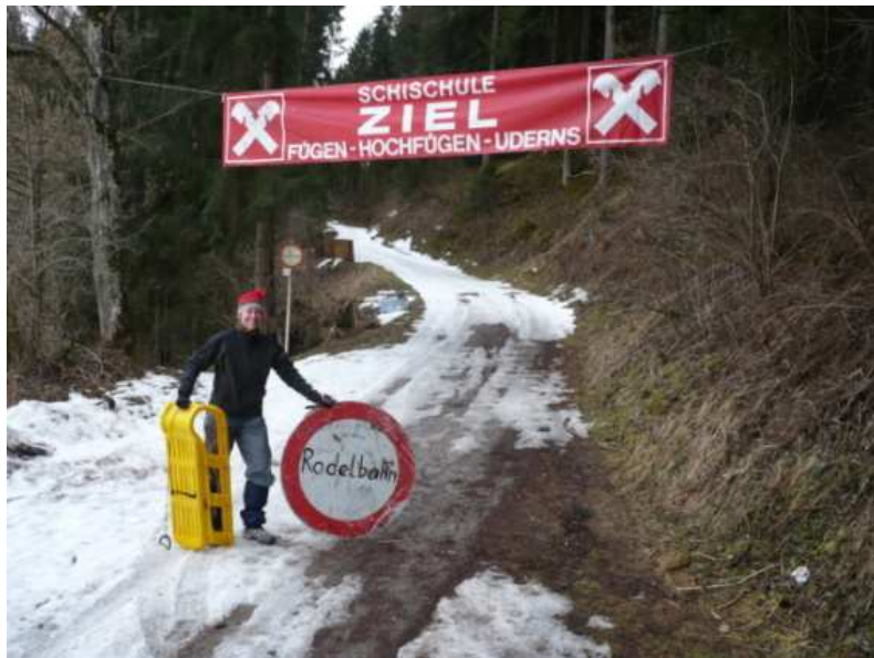
Závěr sáňkařské dráhy u Uderns.

Ze sáňkařských drah, v jinak lyžařsky známém Zillertalu, jsme částečně vyzkoušeli Rodelbahn u vesničky Uderns. Má být dlouhá 3,5km, ale bohužel její začátek neleží v největší nadmořské výšce a tak v době naší návštěvy už zbylo trochu sněhu jen tam, kde ho dříve udusali sáňkaři. Část jsme přesto sjeli a bravurně ( bez ztráty kytičky ) jsme prokličkovali po sněhových flecích až do cíle.