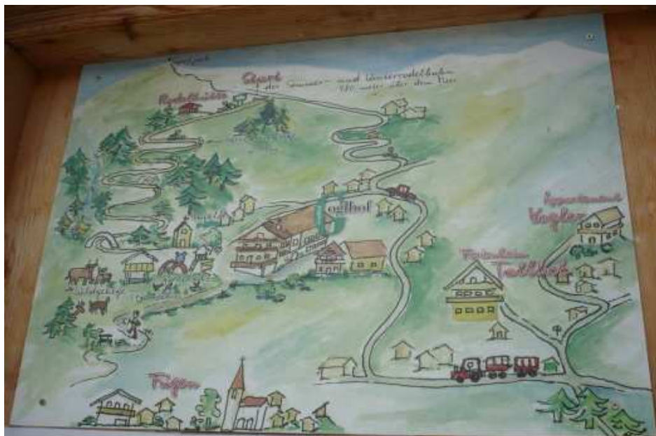
Mapa sáňkařské dráhy. Vlevo se klikatí z Fügenu až k Rodelhütte, s mezistanicí u Goglhofu, obory a dětského hřiště.

Poslední Rodelbahn, kterou jsme zatím vyzkoušeli vede z města Fügen. Zde je také možnost využít půjčovnu sánek a Rodelexpres. Dráha je dlouhá 2,5km s převýšením 350m. Bohužel trať neupravují a tak horní část jsme museli místo sjezdu, který by byl parádní, částečně i jít, protože to v hlubokém sněhu moc nejelo. Dole to však již frčelo skoro třicítkou ☺.