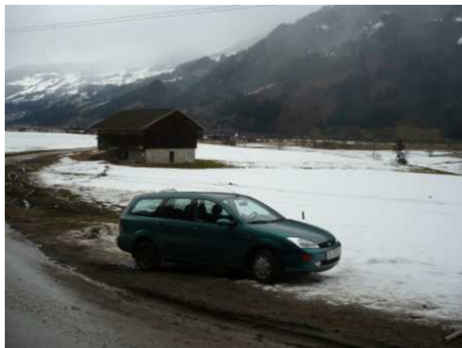
Ne přímo ideální podmínky pro sáňkování nám u Rodelbahn zajistily spoustu místa na parkování.

Jízda zručnosti :). Při ostrém sjezdu jsme ani jednou neslezli ;).